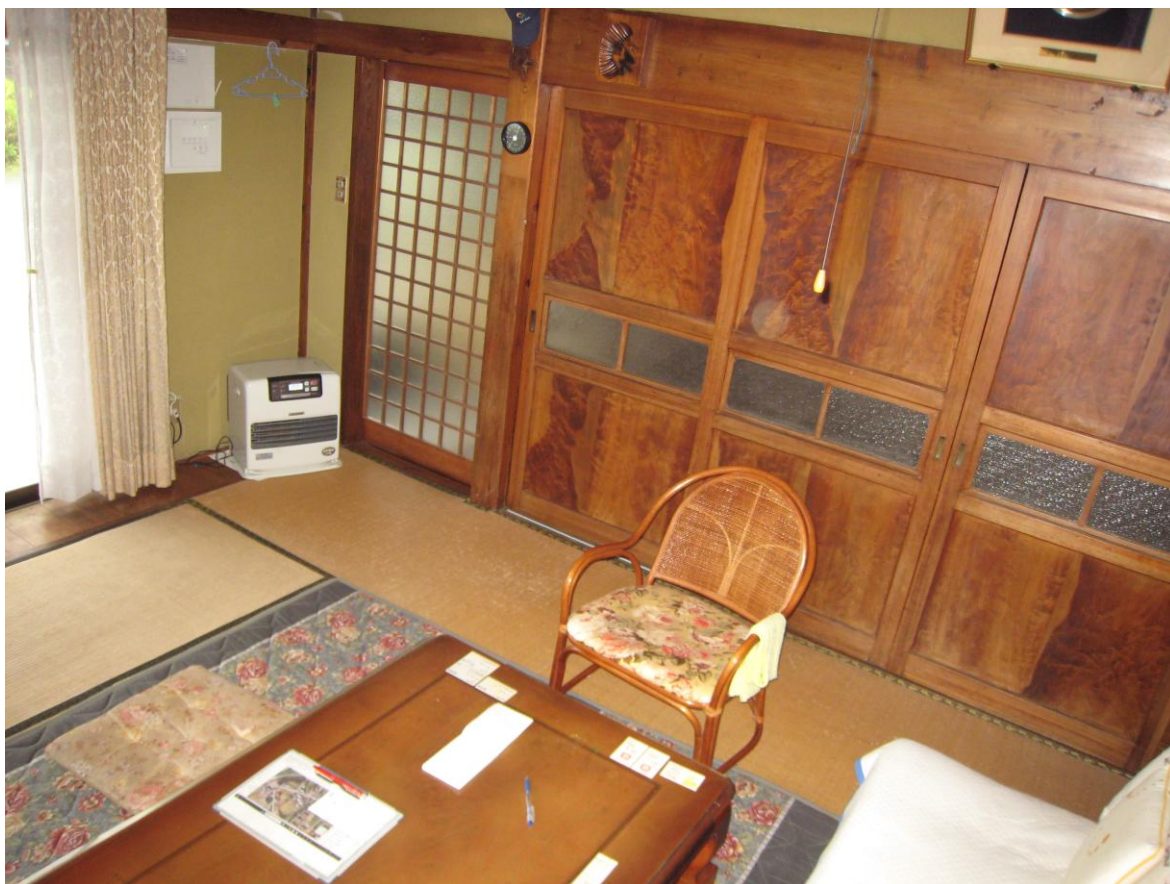
【内観】（リビング天井）