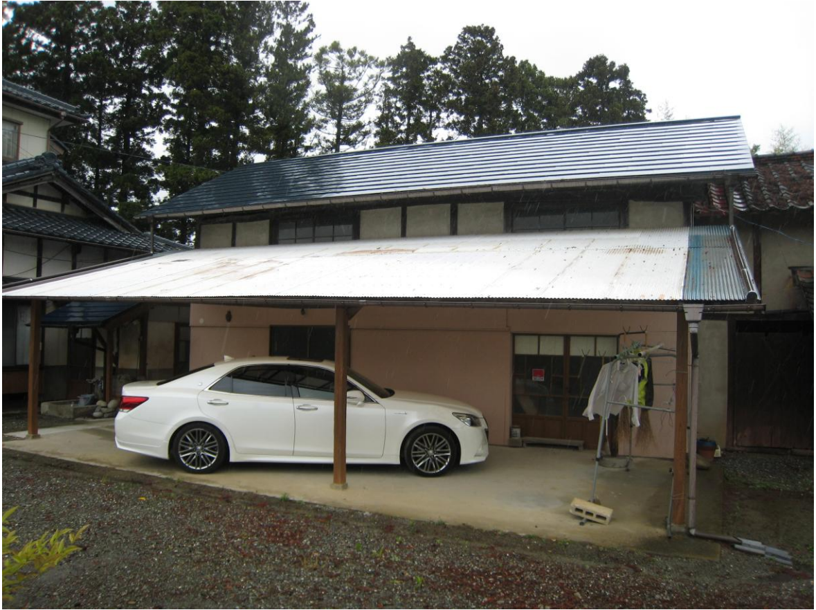
【外観】（作業場・家畜舎）