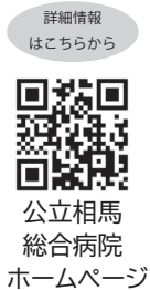
詳細情報は こちらから