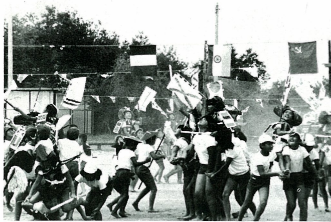
秋空の下 運動会 9月は運動会の季節。9月6日浜保育所、13日福田保育所、駒ヶ嶺小学校、28日駒ヶ嶺保育所でそれぞれ運動会が行われ、秋空の下綱引きや玉入れ、おゆうぎなどに楽しい一日を過ごしていました。